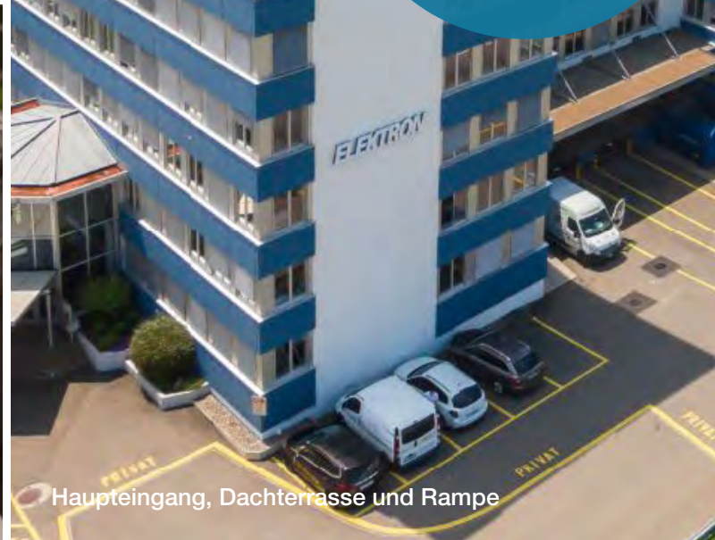
Haupteingang, Dachterrasse und Rampe