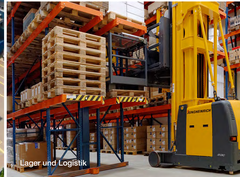
Lager und Logistik